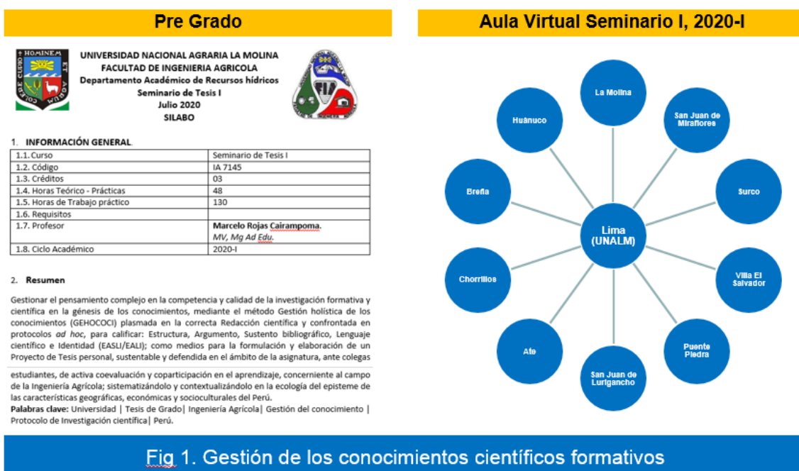
Fig 1. Gestión de los conocimientos científicos formativos

En efecto, es parte del Curso precisado en el mapa mental de la Fig 1 donde se le gestiona científicamente mediante el protocolo EALI (Estructura, Argumento, Lenguaje científico e Identidad), en esta oportunidad en un aula virtual.